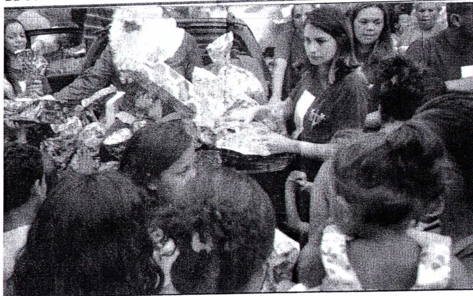
Além da ceia e da distribuição de alimentos, Papai Noel entregará 500 brinquedos para as crianças

Em tempos de crise, a ceia pode ser a única refeição para pessoas carentes neste Natal. E é nisso que o grupo de Sarar irá ao encontro de 200 famílias no bairro Figueira II, Nova Iguaçu, neste sábado, dia 24, no campo do Rala Coco, localizado a Rua Ma-